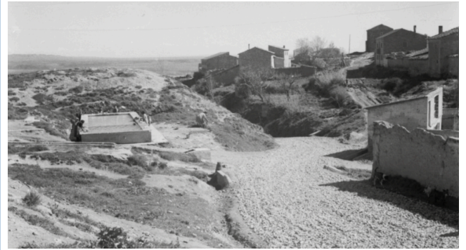
Vista de la Baixada del Calvari amb el safareig en ús.