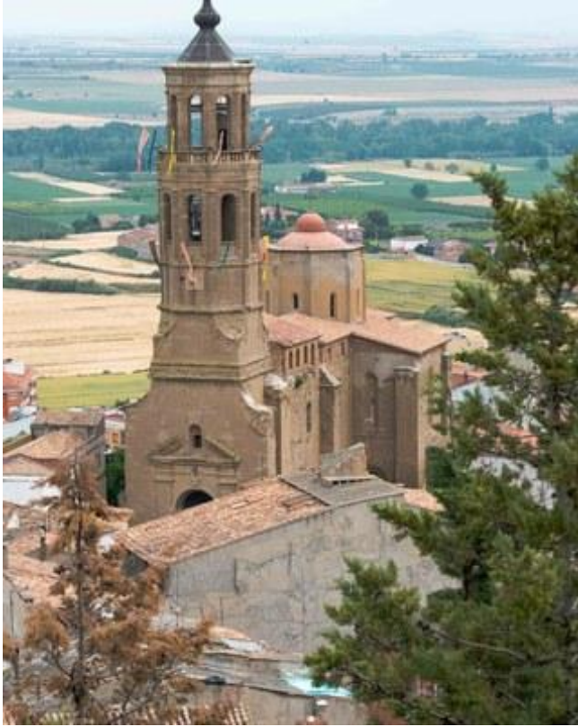
Església parroquial de Santa Maria